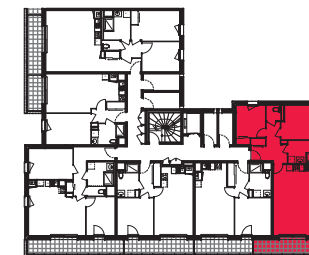
Plan de repérage